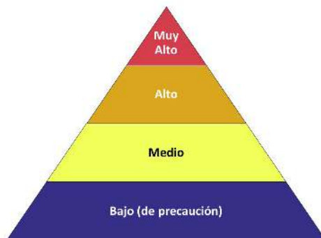
Pirámide de riesgo ocupacional para el COVID-19

El riesgo de los trabajadores por la exposición ocupacional al SARS-CoV-2, el virus que causa el COVID-19, durante un brote podría variar de un riesgo muy alto a uno alto, medio o bajo (de precaución). El nivel de riesgo depende en parte del tipo de industria, la necesidad de contacto a menos de 6 pies de personas que se conoce o se sospecha que estén infectadas con el SARS-CoV-2, o el requerimiento de contacto repetido o prolongado con personas que se conoce o se sospecha que estén infectadas con el SARS-CoV-2. Para ayudar a los empleadores a determinar las precauciones apropiadas, OSHA ha dividido las tareas de trabajo en cuatro niveles de exposición a riesgo: muy alto, alto, medio y bajo. La Pirámide de riesgo ocupacional muestra los cuatro niveles de exposición a riesgo en la forma de una pirámide para representar la distribución probable del riesgo. La mayoría de los trabajadores norteamericanos probablemente estarán en los niveles de riesgo de exposición bajo (de precaución) o medio.